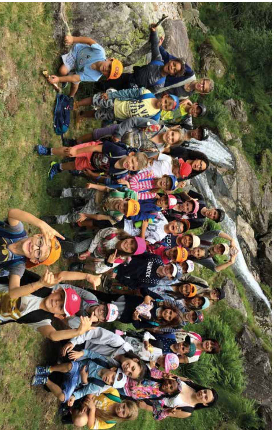
Tutti i grandi sono stati bambini una volta. (Ma pochi di essi se ne ricordano).