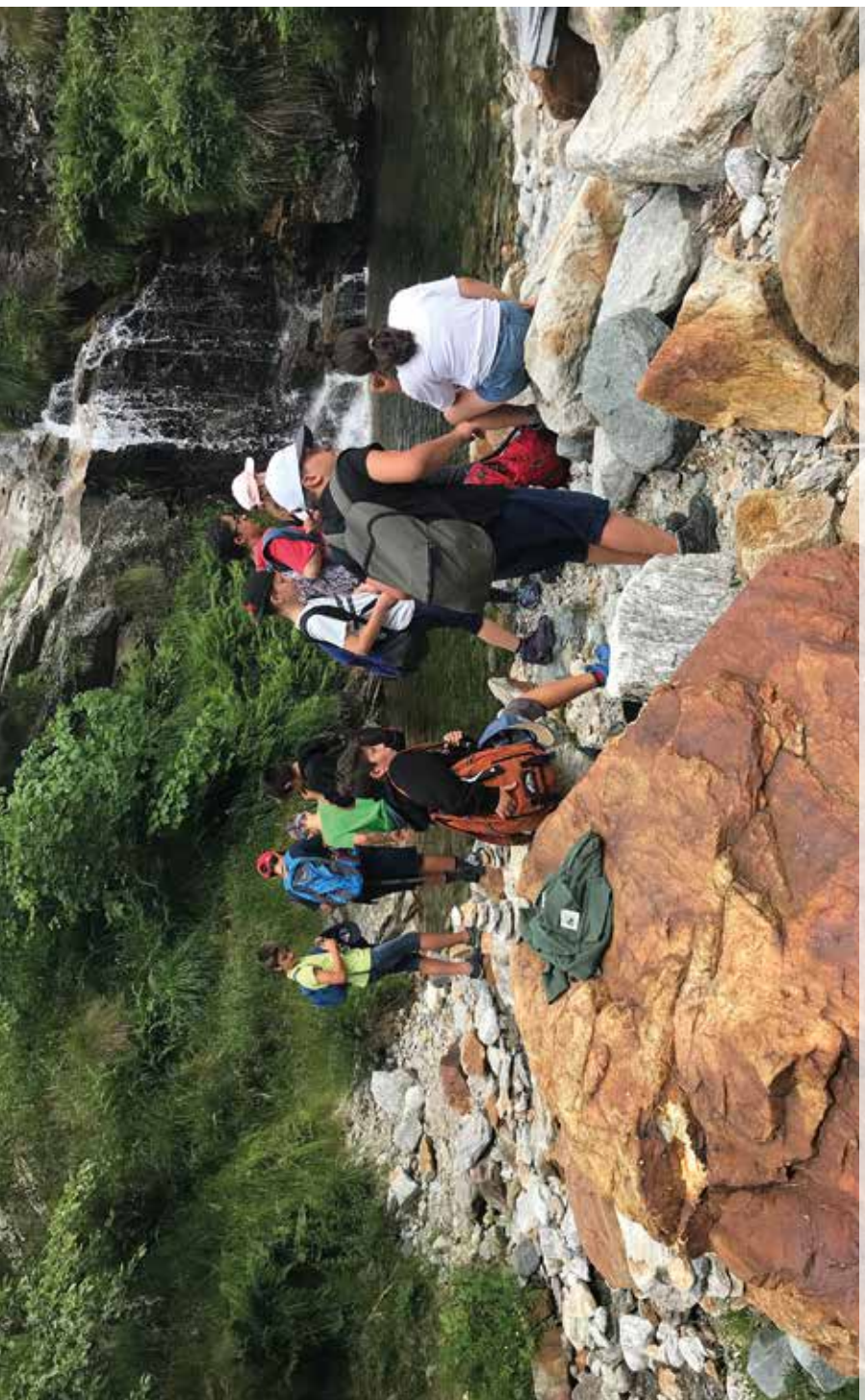
Non sei mai stato bambino se non sei saltato a piedi pari dentro una pozzanghera, svegliando le fate che dormivano e facendole saltare in mille gocce di luce fino al cielo.